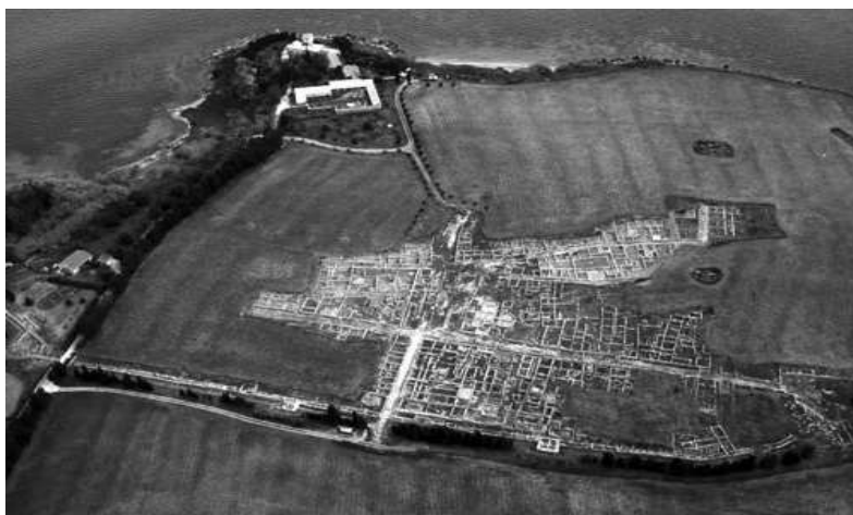
Il sito di Megara Hyblea , fondato nel 728 a.C.

Dal 2018 la Società Augustana di Storia Patria ha dato avvio alla pubblicazione del Bollettino, il cui editoriale questa volta è stato affidato allo scrivente nella sua qualità di Direttore del Parco Archeologico di Leontinoi, ente al quale è stata assegnata la gestione e la valorizzazione dell'area di Megara Hyblaea nel territorio di Augusta, uno dei più importanti siti della ricerca archeologica nel Mediterraneo. Qui, dal secondo dopoguerra in poi, sono state eseguite annualmente attività di scavo sistematico e studio del patrimonio culturale, ciò grazie all'assidua collaborazione fra la Soprintendenza di Siracusa e la Scuola Francese di Roma, che hanno garantito la continua presenza di una missione di scavo a Megara.