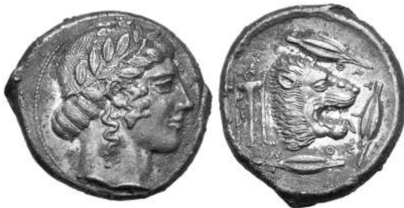
Tetradramma, Leontinoi c.460 – 450 a.C.